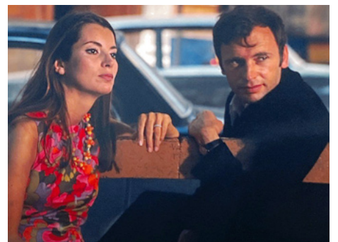
1968 LE VOLEUR DE CRIMES de Nadine Trintignant avec Jean-Louis Trintignant