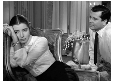
1958 LES ÉPOUX TERRIBLES (Nata di marzo) d'Antonio Pietrangeli avec Gabriele Ferzetti