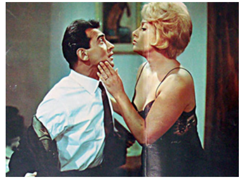
1961 LE CONGRÈS DES MARIS (Mariti a congresso) de Luigi Filippo D'Amico avec Walter Chiari