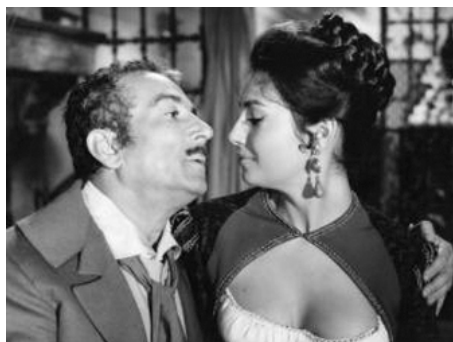
1960 FERDINAND ROI DE NAPLES (Ferdinando I, re di Napoli) de Gianni Franciolini avec Peppino De Filippo