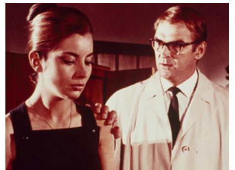
1966 L'ACCIDENT (Accident) de Joseph Losey avec Stanley Baker