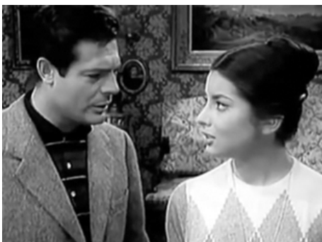
1959 TOUS AMOUREUX (Tutti innamorati) de Giuseppe Orlandini avec Marcello Mastroianni