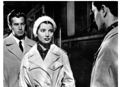
1959 NOUS SOMMES TOUS COUPABLES (Il Magistrato) de Luigi Zampa avec Massimo Serato, José Suarez