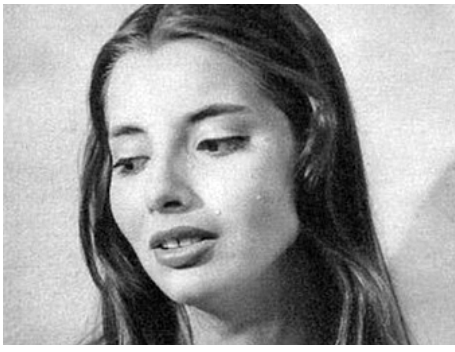
1955 JE PLAIDE NON COUPABLE d'Edmond T. Gréville