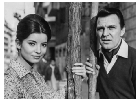
1961 I SOLITI RAPINATORI A MILANO de Giulio Petroni avec Franco Fabrizi