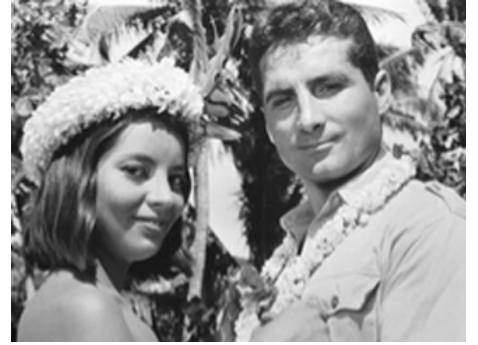
1962 FREDDY DANS LES MERS DU SUD (Freddy und das lied der Südsee) de W. Jacobs avec Freddy Quinn