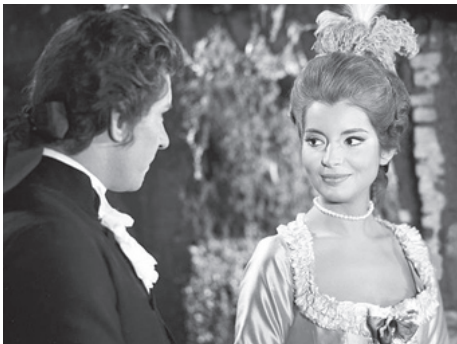
1964 LE SEXE DES ANGES (Le Voci bianche) de Pasquale Festa Campanile avec Paolo Ferrari