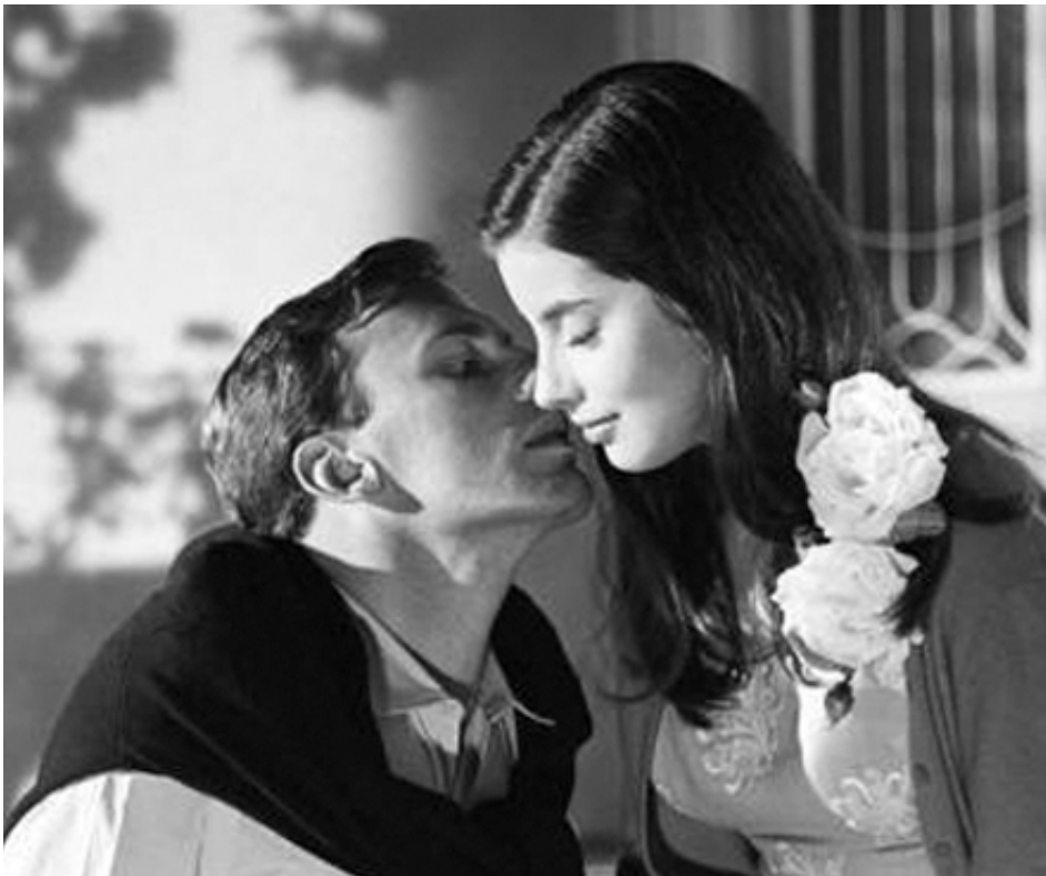
1959 ÉTÉ VIOLENT (L'Estate violente) de Valerio Zurlini avec Jean-Louis Trintignant