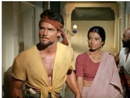
1964 LES PIRATES DE MALAISIE (Il Pirati della Malesia) d'Umberto Lenzi avec Steve Reeves