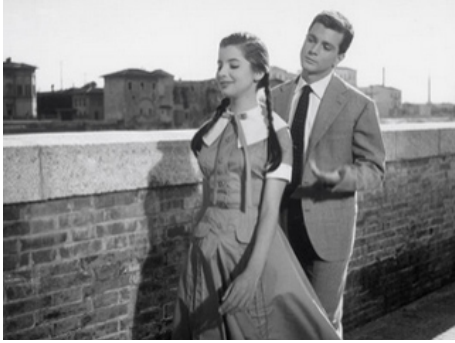
1956 GUENDALINA (Guendalina) d'Alberto Lattuada avec Raffaele Mattoli